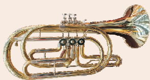
Bassflügelhorn Drehventile aufgestellt

Nutzen Sie den Workshop und probieren Sie unsere Instrumente.